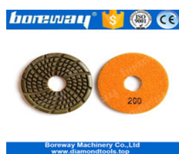
Tamponi per lucidatura per macinazione del calcestruzzo