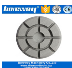
Cuscinetti per pavimenti Diamond rinnovati