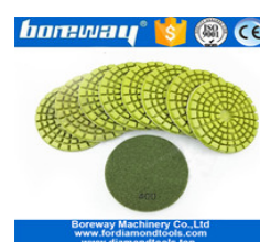
Tamponi per lucidare il pavimento ispessiti