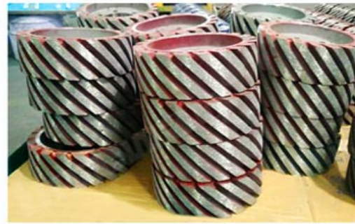
Diamond Satellite Wheel/ Rollers