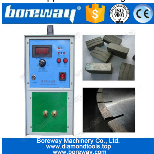
Diamond saw blade welding