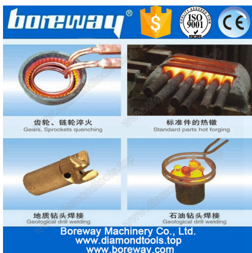
A variety of materials welding

Allegato: Interruttore a pedale / interruttore manuale-stampa, batteria di riscaldamento (può essere adattato), tubi di acqua, pompe per l'acqua (necessità di comprare).