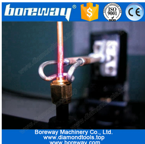
Copper tube welding