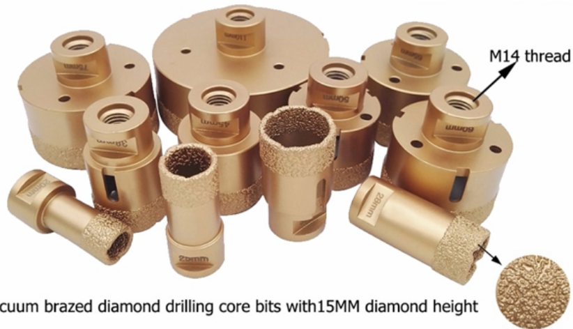
Vacuum brazed diamond drilling core bits with 15MM diamond height

Diameter 20mm, 25mm, 28mm, 30mm, 32mm, 35mm, 38mm; 43mm, 45mm, 50mm, 55mm, 60mm, 65mm, 68mm; 70mm, 75mm, 80mm, 90mm, 100mm, 110mm, 115mm, 125mm