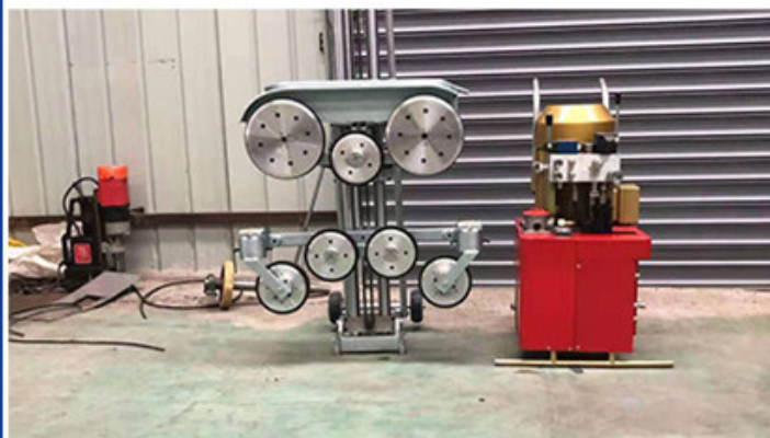
Hydraulic Wire Saw Cutting Machine