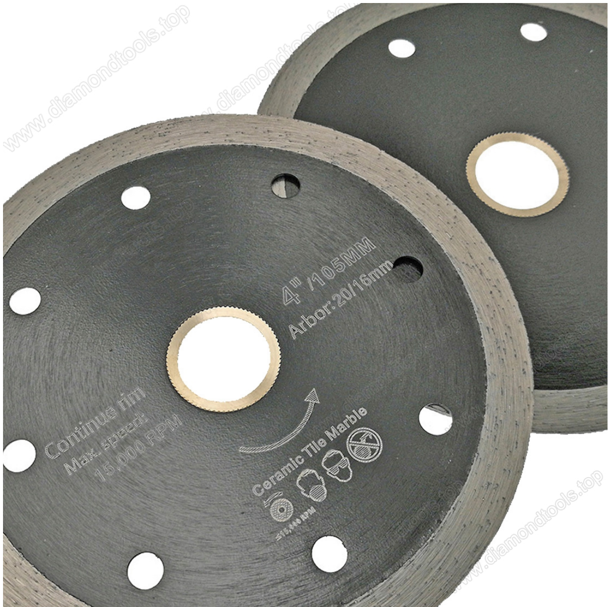
4,5 pollici Disco a disco diamantato a taglio continuo a caldo sottile con lame diamantate