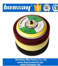
Fondello in schiuma da 5 pollici