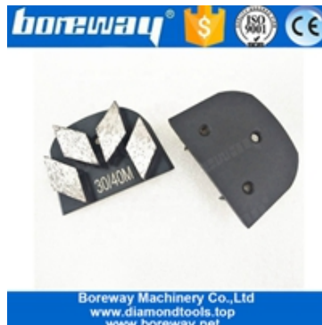
Scarpe abrasive a quattro segmenti