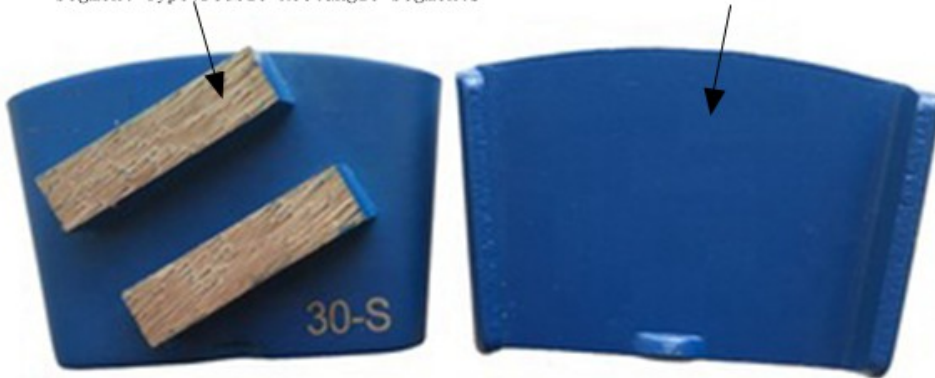
Connection Type: HTC Type

For more information, please visit our website: www.terrazzo.com