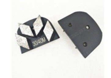
Boreway Machinery Co.,Ltd www.diamondtools.top www.boreway.net