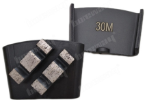
Boreway Machinery Co., Ltd www.diamondtools.top www.boreway.net