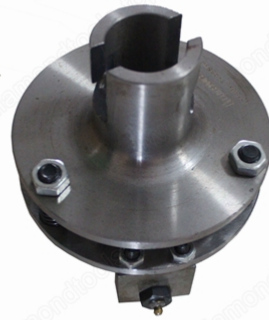
Boreway Machinery Co., Ltd. www.diamondtools.top www.boreway.com