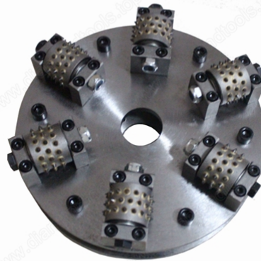
Boreway Machinery Co., Ltd. www.diamondtools.top www.boreway.com