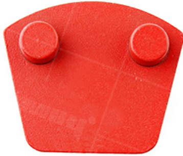
Werkmaster Two Pins Fan Shape Blank