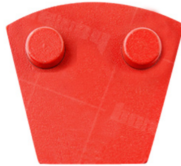
Werkmaster Two Pins Trapeziod Shape Blank