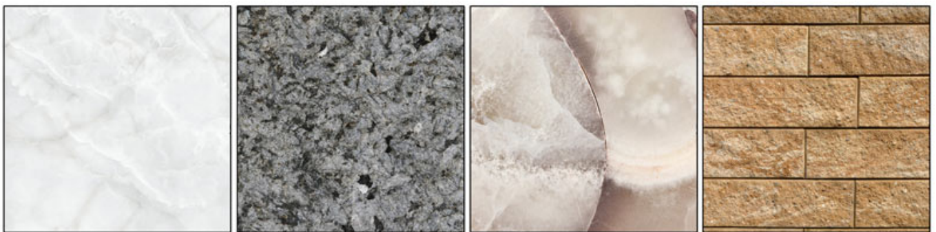
Marble Granite Quartz Sandstone