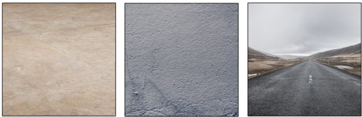
Limestone Concrete Floor Asphalt Pavement