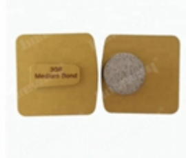
Boreway Machinery Co.,Ltd www.diamondtools.top www.boreway.net