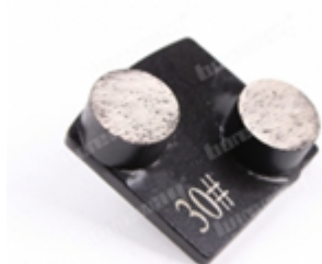
Boreway Machinery Co.,Ltd www.diamondtools.top www.boreway.net