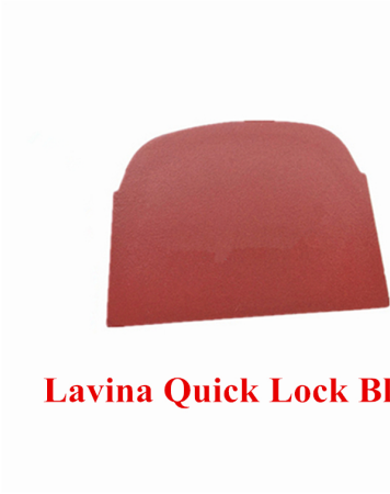
Lavina Quick Lock Blank