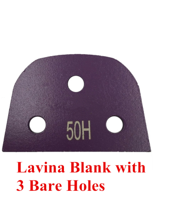
Lavina Blank with 3 Bare Holes