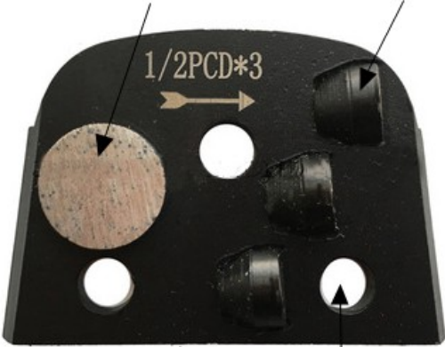
Hole: Three Bare Holes