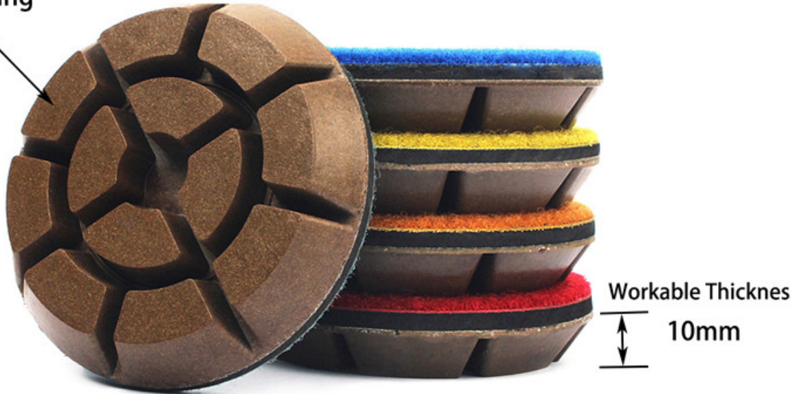
Metal Filling Diamond Resin Bond Polishing Pads For Concrete Floor