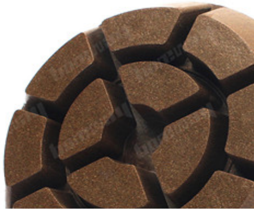
Boreway Machinery Co.,Ltd www.diamondtools.top www.boreway.net

此項產品 係由 本公司 自行 研製 生產 之 鑽石 磨輪 產品 係由 本公司 自行 研製 生產 之 鑽石 磨輪 產品