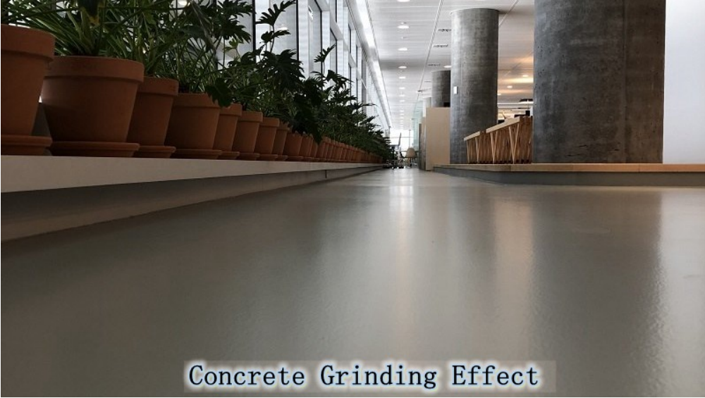
Concrete Grinding Effect