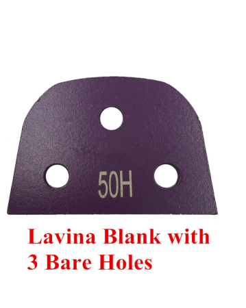
Lavina Blank with 3 Bare Holes