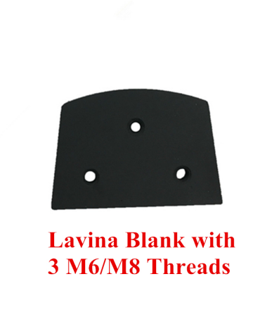
Lavina Blank with 3 M6/M8 Threads