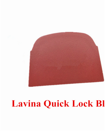
Lavina Quick Lock Blank