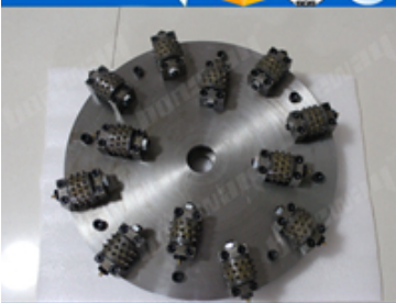
Boreway Machinery Co., Ltd www.diamondtools.top www.boreway.com