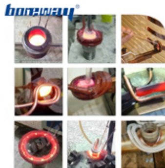
Three Phase 380V 30kW High Frequency Induction Welding Machine Three Phase 380V, 20kW, 50Hz, High Frequency Induction Welding Machine