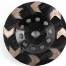
Boreway Machinery Co., Ltd www.diamondtools.top www.boreway.net