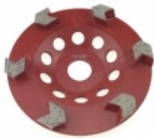
Boreway Machinery Co., Ltd www.diamondtools.top www.boreway.net