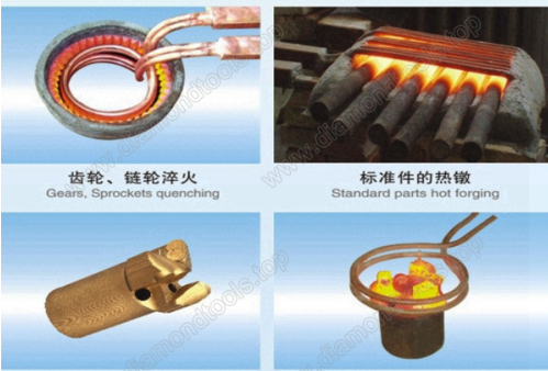
齿轮、链轮淬火 Gears, Sprockets quenching