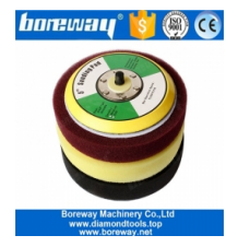
5 鑽頭 鑽頭