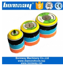
5/16"-24 鑽頭 鑽頭