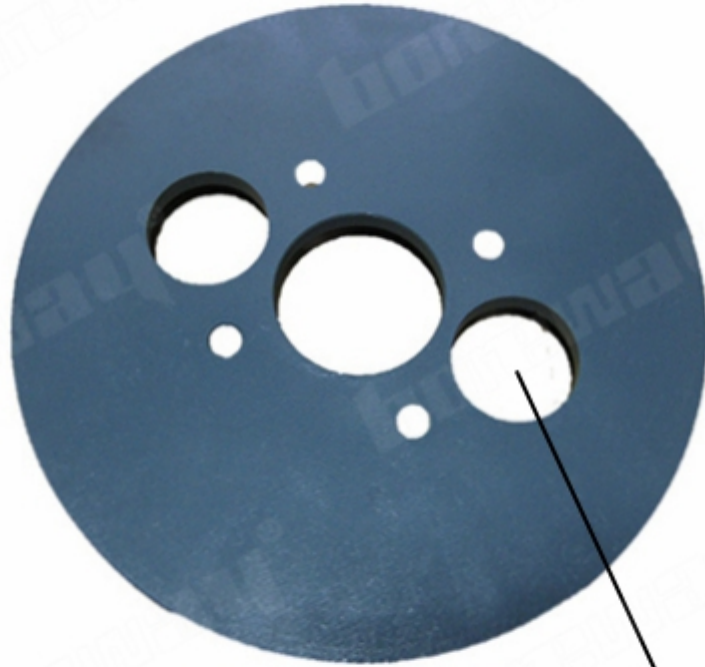
Quick Lock Connection General Grinding Machine