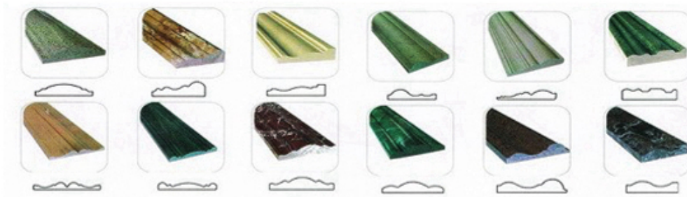
异形磨边效果 Type of profile stone