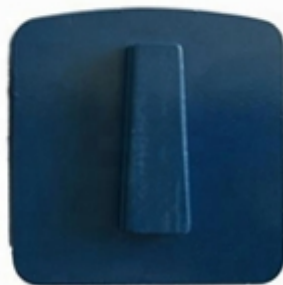
Husqvarna Redi Lock Blank Scanmaskin Blank