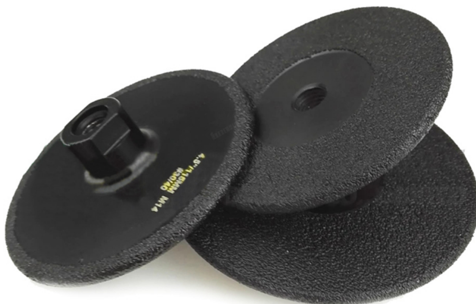
Vacuum Brazed Diamond Grinding Wheel

Boreway Machinery Co., Ltd. www.diamondtools.top www.boreway.com