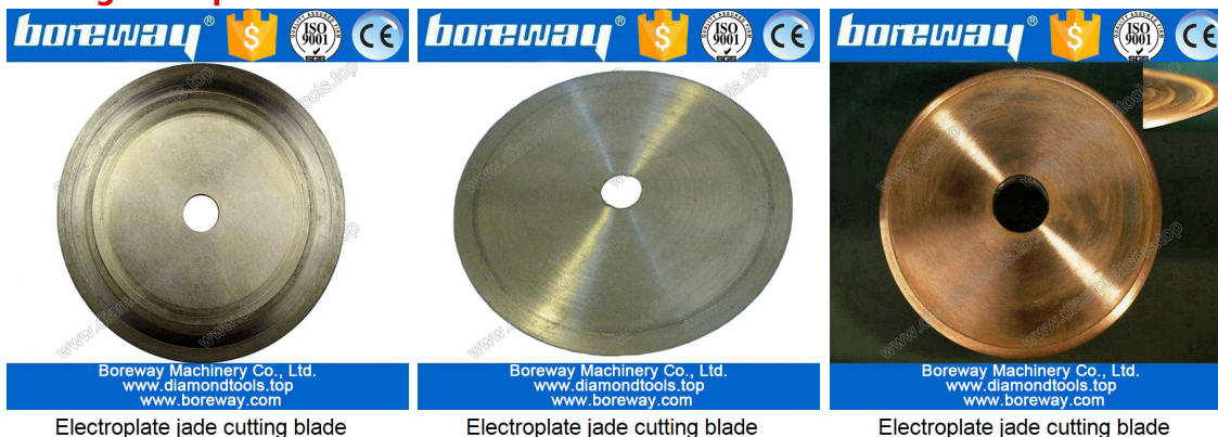
Electroplate jade cutting blade

Si vous ne voyez pas le produit que vous voulez, s'il vous plaît nous contacter pour plus d'images de produits.