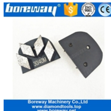
Meules à quatre segments