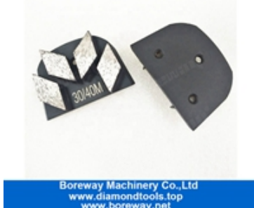
Patins de meulage à quatre segments