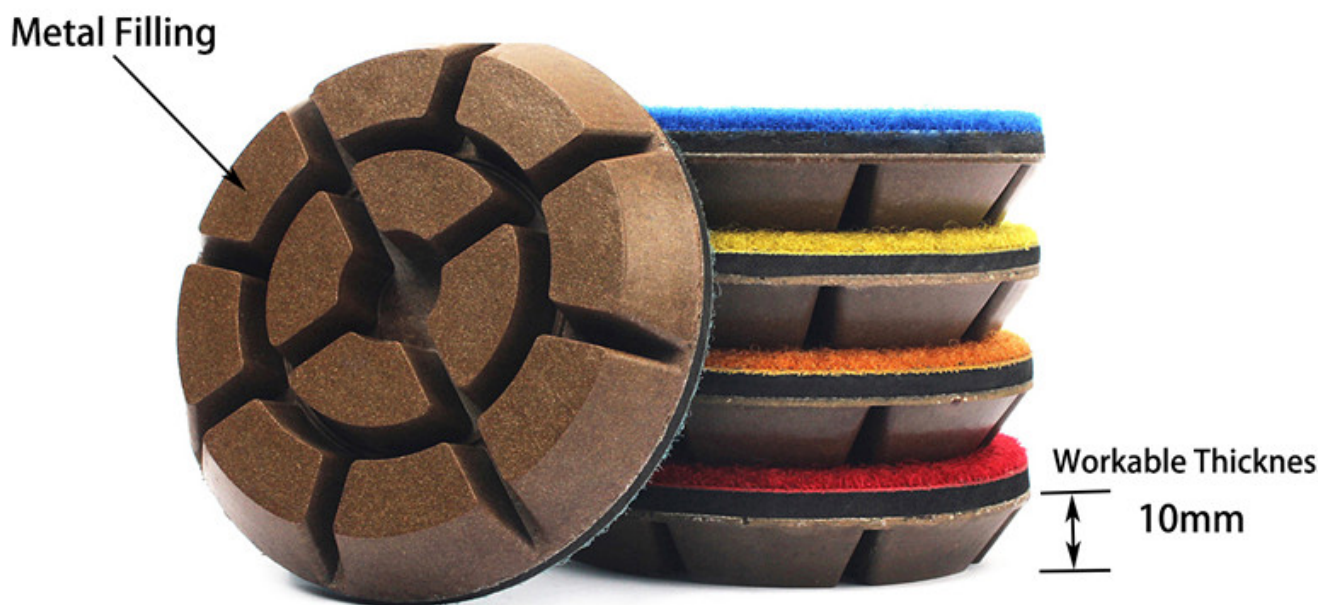
Metal Filling Diamond Resin Bond Polishing Pads For Concrete Floor