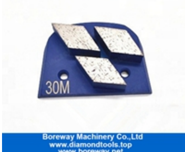
Mâchoires à trois segments