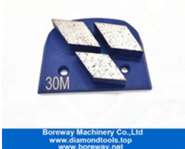
Mâchoires à trois segments