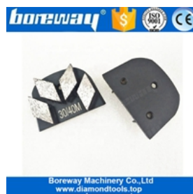
Patins de meulage à quatre segments