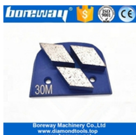
Chaussures de meulage à trois segments