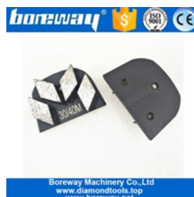
Patins de meulage à quatre segments