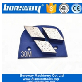
Chaussures de meulage à trois segments