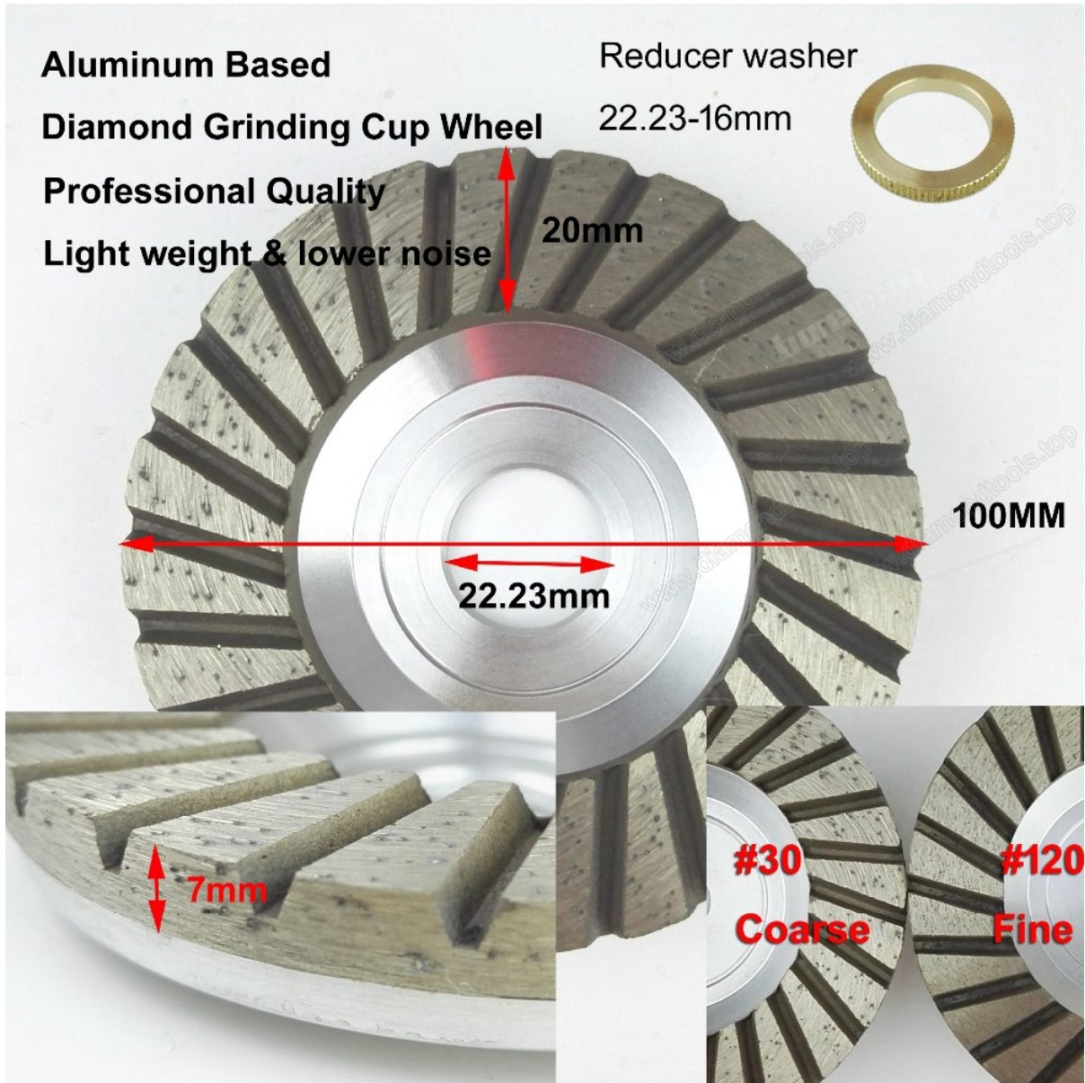
30 # haute qualité plat turbo en aluminium base diamant meule coupe pour la pierre