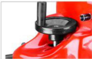
高度调节手把和调速器