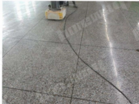
Before Grinding and Polishing