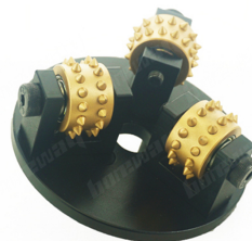
HTC 270MM Bush Marteau Plaque

Boreway Machinery Co.,Ltd www.fordiamondtools.com www.diamondtools.top