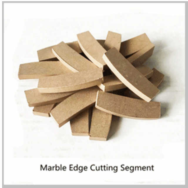
Marble Edge Cutting Segment