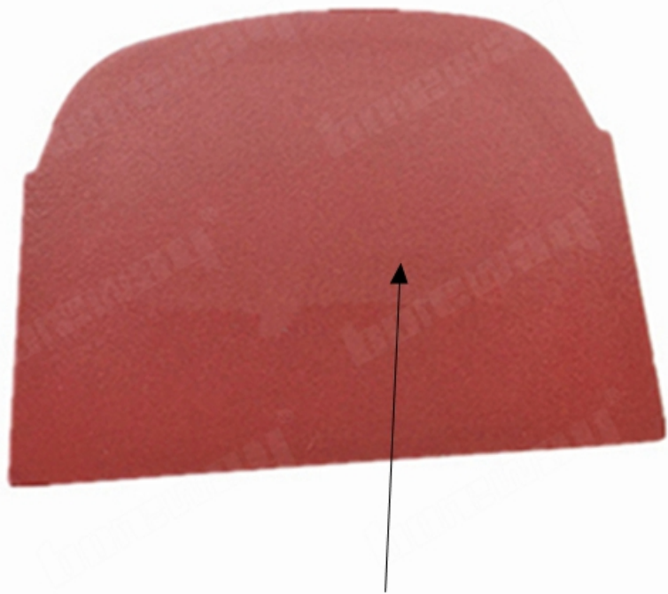
Lavina Quick Lock Blank