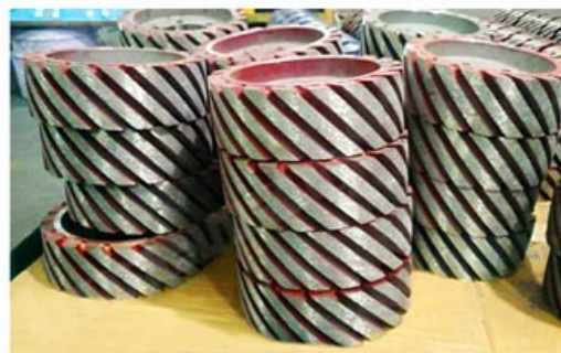
Diamond Satellite Wheel/ Rollers