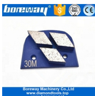
Chaussures de meulage à trois segments