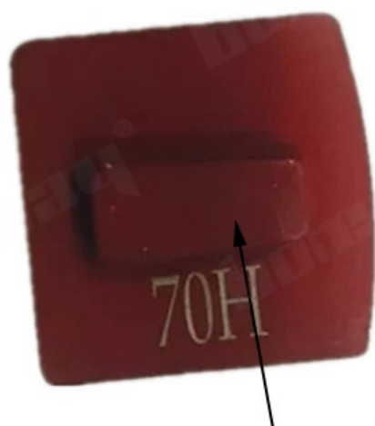
Husqvarna or Scanmaskin Redi Lock