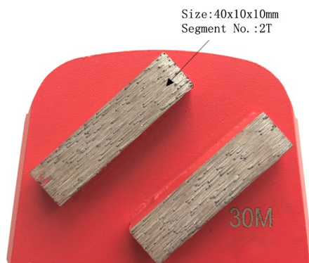
Lavina Concrete Floor Diamond Grinding Plate

Le double rectangle segmente des outils de diamant de Lavina pour le meulage concret: