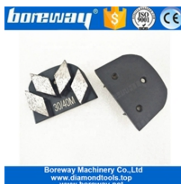
Quatre secteurs de chaussures de meulage