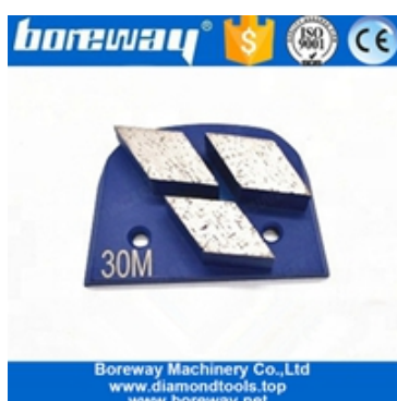
Trois secteurs de la rectification de chaussures