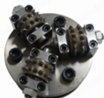
Boreway Machinery Co., Ltd www.diamondtools.top www.boreway.com