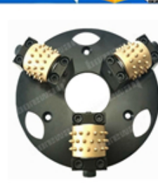
Boreway Machinery Co., Ltd www.fordiamondtools.com www.diamondtools.top