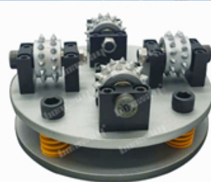
Boreway Machinery Co., Ltd www.fordiamondtools.com www.diamondtools.top