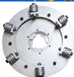
Boreway Machinery Co., Ltd www.fordiamondtools.com www.diamondtools.top