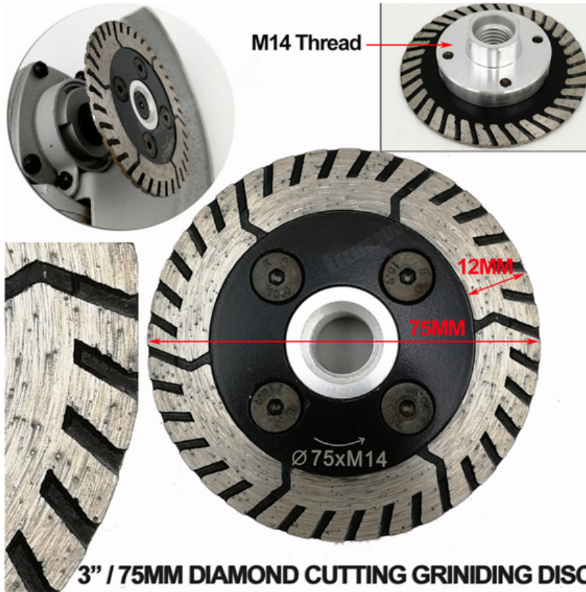
3" / 75MM DIAMOND CUTTING GRINDING DISC

Boreway Machinery Co., Ltd. www.diamondtools.top www.boreway.com